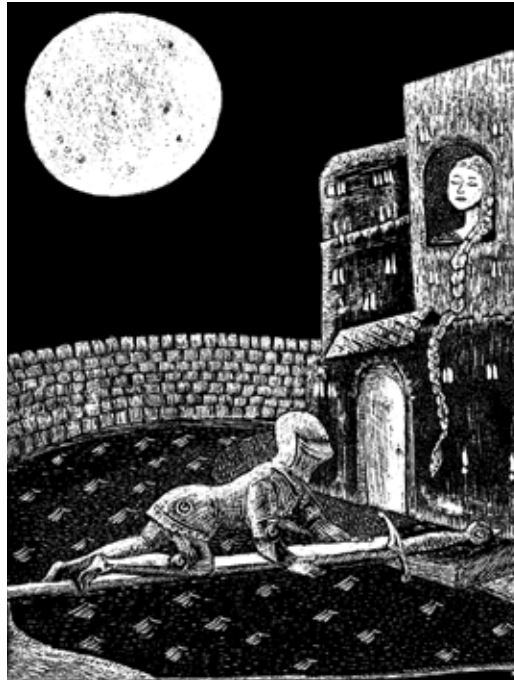
ILLUSTRATION: KAREN COTTING/VERLAG SAGE UND SCHREIBE

Mittelalterliche Minne: Ritter Lancelot will Ginevras Herz erobern – die Frau von König Artus